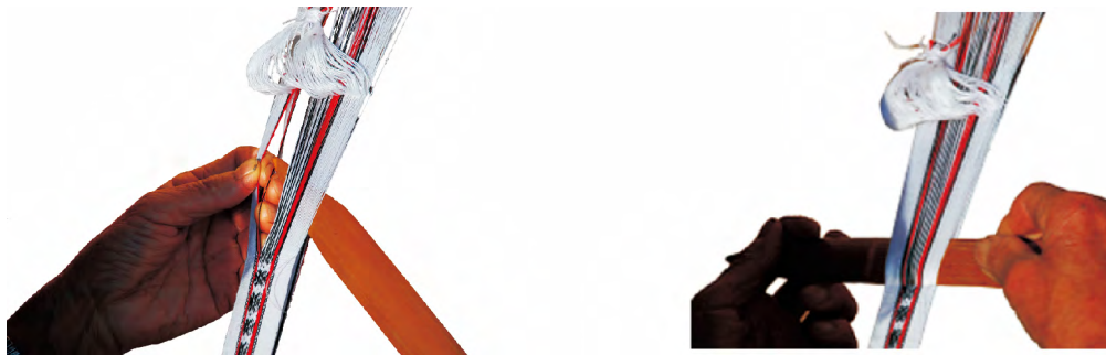
图 4 织纹

毕的白线和彩色线为经线 ,以白色纱线为纬线 ,削尖的竹片为打纬刀(“耕带摆”)。打纬刀在经线中按照图案需要穿插后立起形成开口 ,起到引纬功能 ,纬线从此穿过 ,并用打纬刀压紧固定 ,在白色边条部分形成平纹组织 ,在中间花纹部分通过纬线在经线上的上下变化形成提花图案 ,如此按照一定的规律循环反复 ,构成彩带中心的织纹(图 4 ,摄于景宁黄山头村)。这种织纹图案是一种简单的提花组织 ,由于是由经线色织而成 ,亦被称为“经锦” [3]103 。纹样在穿经走纬的过程中逐步形成 ,同时由于经锦的提花组织结构 ,形成了彩带字符型织纹均为 45°斜向排列的特征。