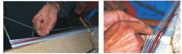
图 2 整经 Fig. 2 Warping

外侧为白色纱线 ,中间图案带的两边用彩色线点缀 ,带芯以黑线和白线交织形成图案。织纹部位纱线的数量根据织纹(带宽)大小来确定 ,其织纹部分的纱线排列如图 3 所示。对经纱颜色和排列的选择决定了彩带最终成型后的基本色彩基调 ,整经环节结束后 ,彩带已初具雏形。