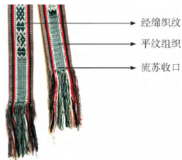
图 5 彩带收口部分

收口是彩带编织的最后一步。整条彩带编织完成后 ,在经锦提花织纹尾部继续织一段平纹组织 ,再在尾端留出一定长度的纱线不进行编织 ,从中间剪断即形成流苏 ,然后将经纬纱打成穗子防止脱散 ,完成收口(图 5 ,蓝咏梅编织)。平纹长度及尾端流苏长度一般与起始位置预留的平纹和纱线长度对应 ,形成两端对称的收口与流苏。由于彩带纱线细致 ,组织紧密 ,不易脱散 ,很多民间自用的彩带简单打结 ,留足流苏长度 ,剪短纱线即可。