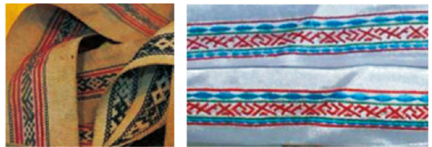
图7 传统手工彩带(左)与现代彩带(右)对比

随着现代社会的飞速发展,文化碰撞与震荡下的传统服饰样式不断蜕变,民族服饰逐渐退出畲民的日常生活。伴随着传统服饰工艺后继乏人的窘状,彩带的传统编织工艺也面临着逐渐失传的危险。现在各地畲村中擅长彩带编织的多为五十岁以上的老人,由于彩带编织不能带来明显的经济收益,年轻人中能静心学习编织技艺的传人少之又少。在现代节庆和表演中使用的新畲服中大量采用机织机绣的现代彩带替代传统手工彩带,其选材与工艺都不够精美,形似而无神,极大地偏离了传统彩带的审美(图7)。